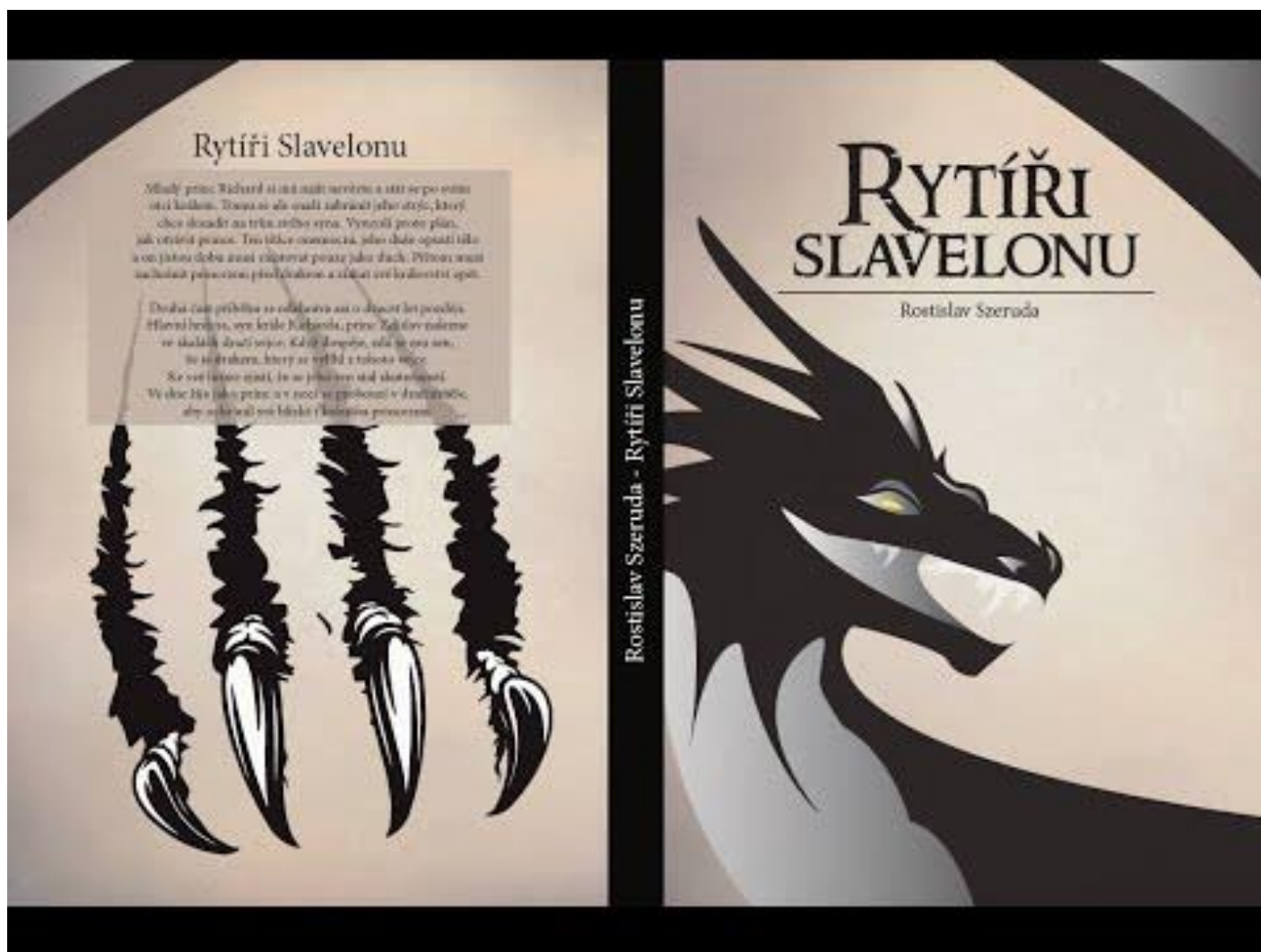
(Trailer k první části knihy Rytíři Slavelonu – Spící princ)