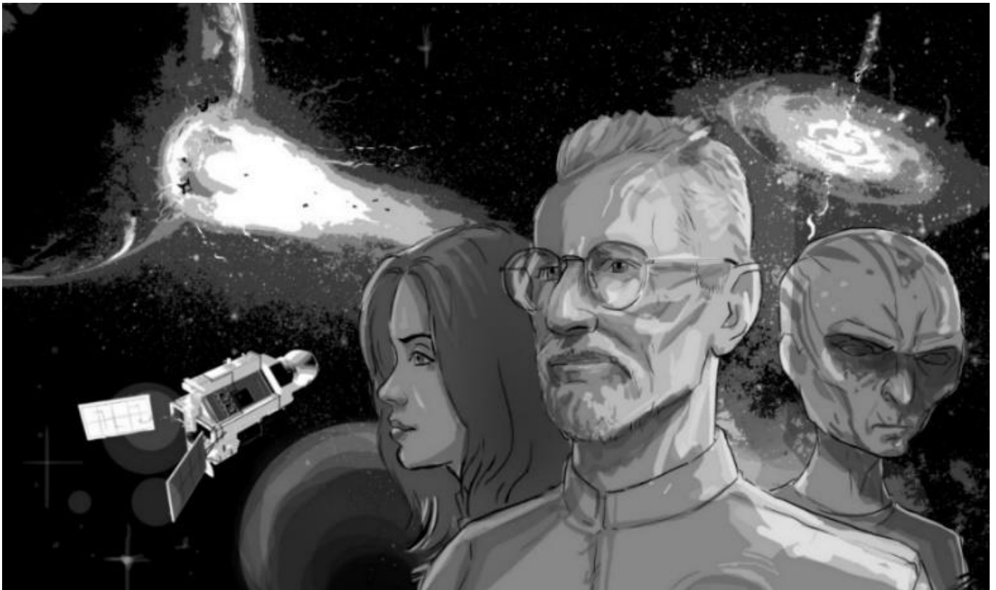
(Ilustrace: Petr Vyoral)